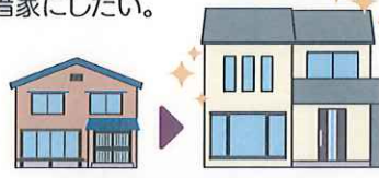
既存住宅の有効活用